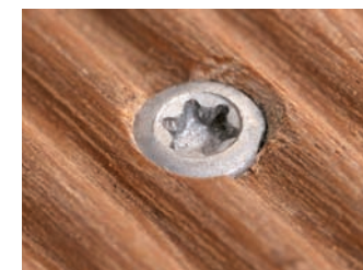
resultaat met voorbereiden