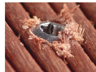
Resultaat zonder voorbereiden