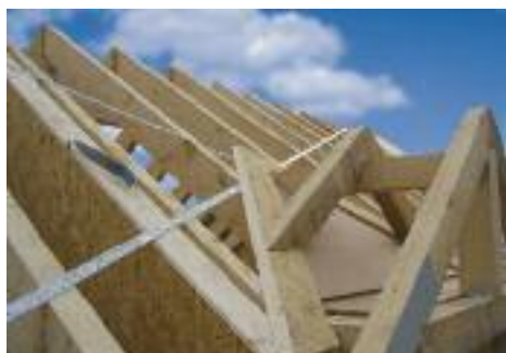
De ideale universele schroef voor alle houtmaterialen.