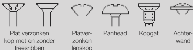
Plat verzonken kop met en zonder freesribben