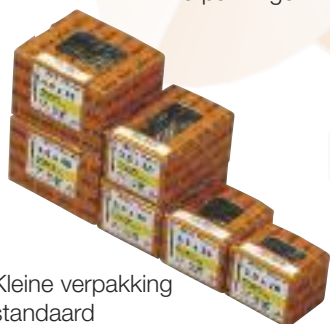
Kleine verpakking standaard