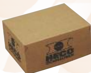
Speciale verpakkingen met losse storting