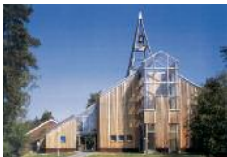
De ideale allround-schroef voor bijna alle toepassingen in de bouw.

De nieuwe HECO-FIX-plus® biedt u een groot aantal voordelen die uw werkzaamheden duidelijk eenvoudiger en effectiever maken.